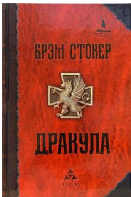
Рисунок 5 Обложка книги о вампире оформлена в чёрно-красной гамме

Это связано с особым восприятием цвета, свойственным большинству людей. Так, красный ассоциируется с кровью и войной, зелёный с природой и покоем, синий с океаном и мудростью, чёрный с трауром и важными делами, розовый с детством и романтикой. Какой бы привлекательной и свежей ни казалась идея нарушить устоявшиеся ассоциации и перевернуть всё с ног на голову, делать этого категорически нельзя, поскольку цветовые стереотипы – свойство психики, а не чьё-то изобретение.