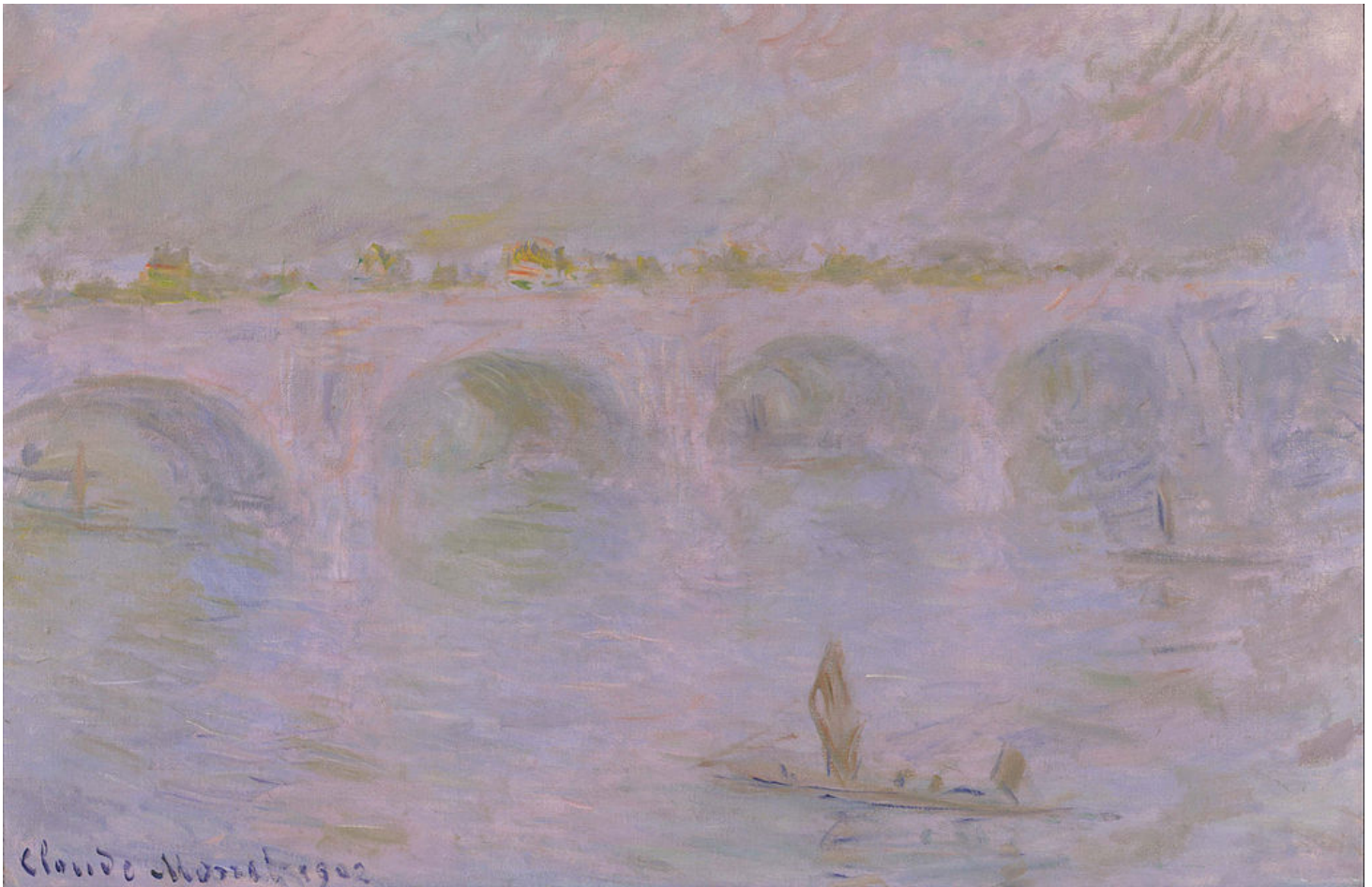
Рисунок 8 Картина Моне «Мост Ватерлоо в Лондоне»