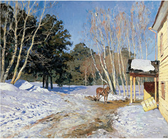
Рисунок 7 Картина Левитана «Март», на которой можно видеть характерные синие тени

Это тем более актуально для книжного оформления, с учётом того, что даже в художественной среде с трудом могут принять отступление от цветовых стереотипов. Например, в позапрошлом веке великого художника Левитана критиковали за синие тени от деревьев на снегу, несмотря на то, что зимой они при определенном освещении на самом деле могут оказаться синими. Эту особенность подметил художник, но зрители, привыкший к серым теням, не могли согласиться с тем, что изображено на картине. В начале прошлого века такую же критику вызывала серия художника Моне, на которой изображены виды Лондона. Художник изобразил Лондонский туман розовым, что возмутило посетителей его выставки. Как оказалось впоследствии, художник был прав, поскольку от кирпичной пыли туман в Лондоне на самом деле иногда бывал розовым.