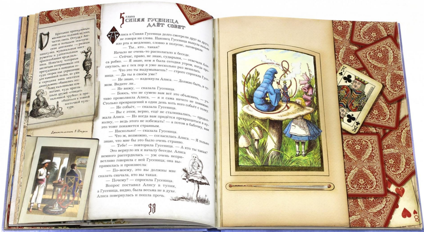
Рисунок 1. Красочная книга